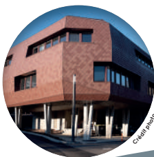
C. Laffay

• Contact - 05 65 47 05 97 / cbbmarcillac@hotmail.fr