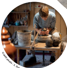
Créati photo - S. Dykstra