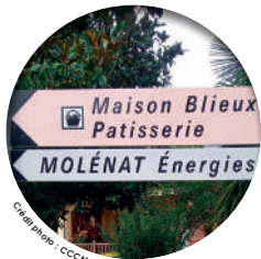
Créati photo - C.C.C.M.