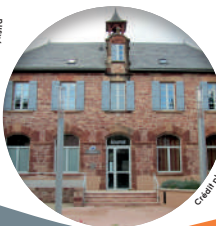
C. Laffay