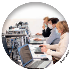
C. Laffay